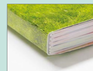
Brossura filo refe